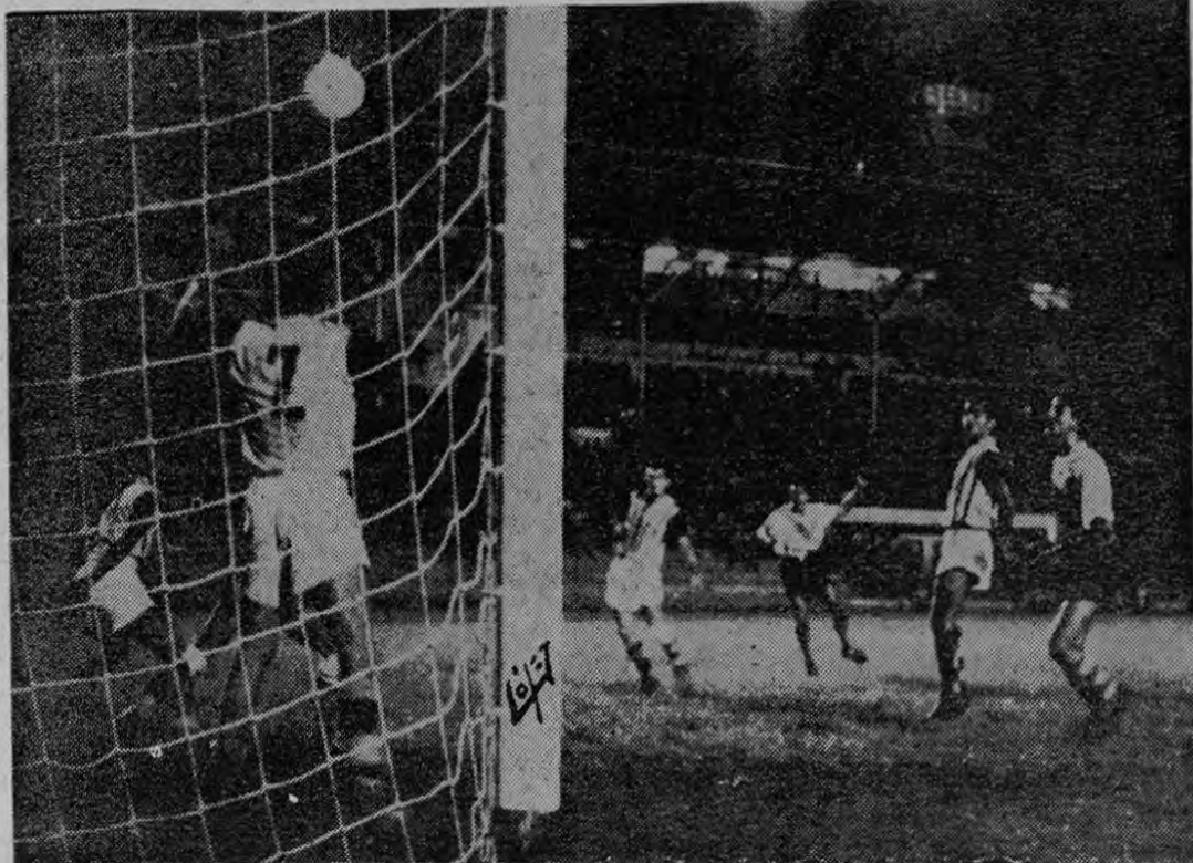
UN GOL DE BANDERA, fue el segundo del Herediano conseguido en maravilloso y potente empalme de Carpio, a la salida de un corner. La foto de López registra el momento en que la pelota se introduce en la red, mientras el autor del disparo mantiene todavía la pierna levantada. El partido nocturno entre Heredia y Uruguay terminó con la victoria de los primeros por 3 a 0

Le hizo anoche el marcador una jargarreta al Uruguay de Coronado. Si un partido de fútbol, pudiera decidirse a los puntos como un combate de boxeo, el encuentro de anoche entre heredianos y uruguayos nos hubiera dado en las cartulinas un vencedor: Uruguay. Pero en fútbol, como en boxeo, existe también el golpe de gracia, la jugada que de un solo ramalazo nivela y a veces anula la superioridad observada hasta entonces por el adversario. En boxeo se llama "punch"; en fútbol, "gol".